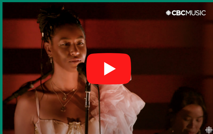
Dominique Fils-Aimé - While We Wait